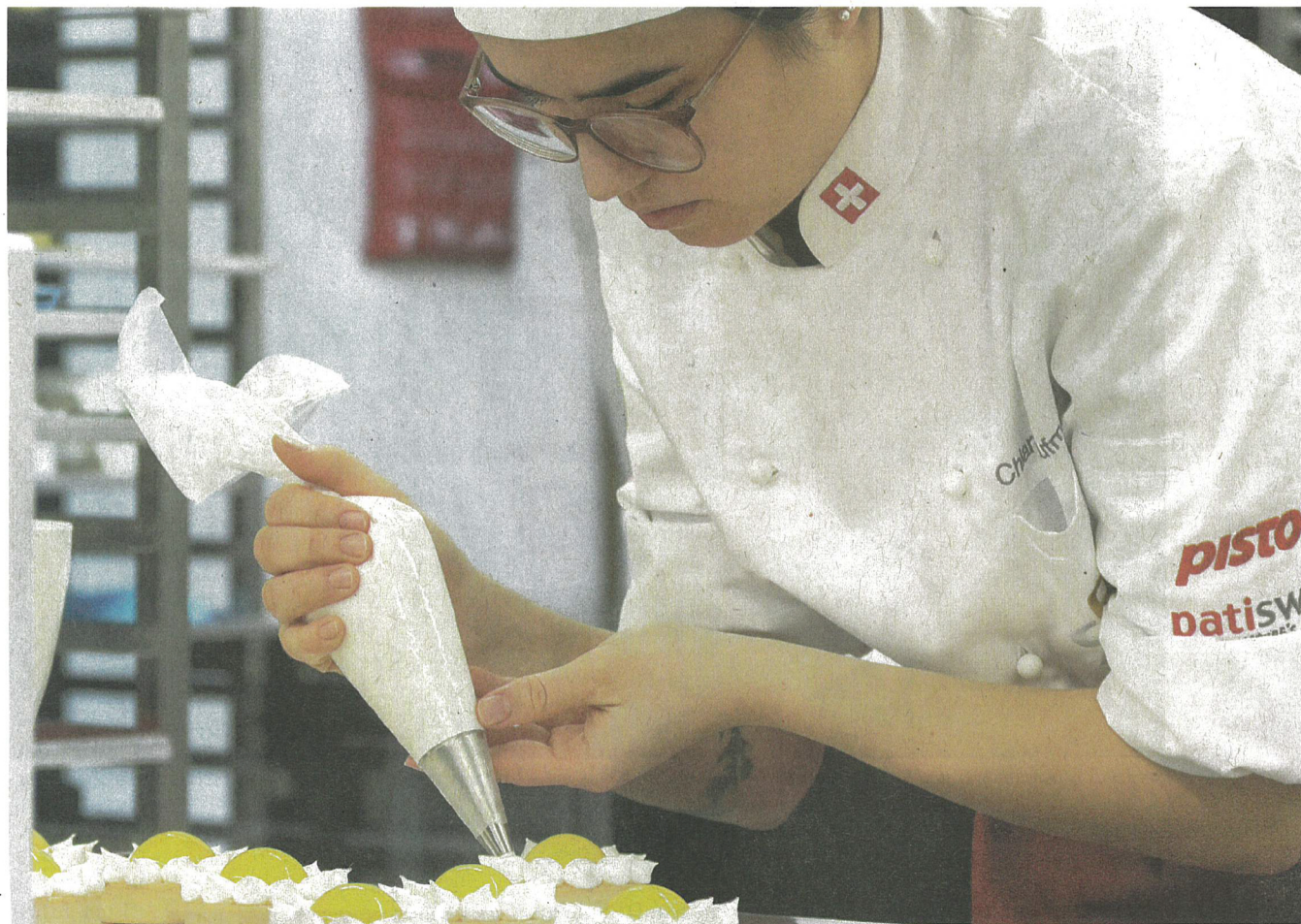
Confiseurin bei der Herstellung von Patisserie – das Handwerk steht exemplarisch für die praxisnahe Berufsbildung in der Schweizer Bäckerei-Confiserie-Branche.